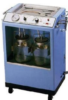
Máy hút dịch