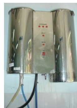
Máy cất nước 20 l/g