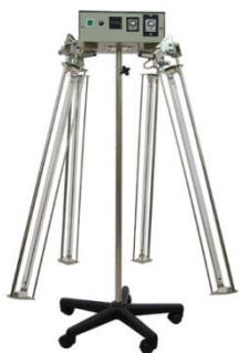
Đèn chống khuẩn