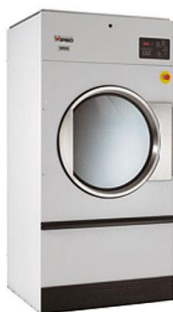
Tủ sấy công nghiệp