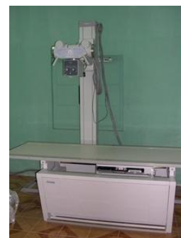
Lắp đặt máy X - Quang